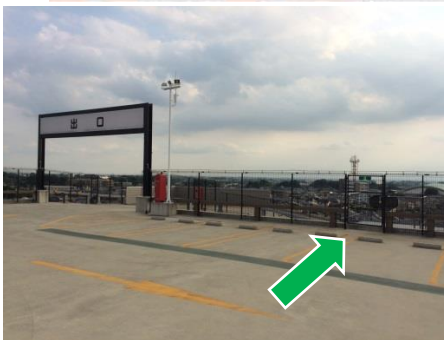
非常階段の徒歩出口（屋上）