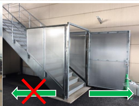
非常階段の出入口（1階）